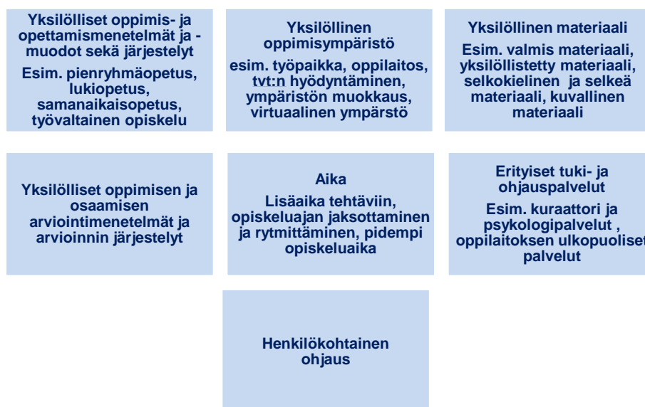
Kuvio 1 Esimerkkejä opetuksen ja ohjauksen yksilöllistämisen keinoista

Mukauttamisen tarvetta tulee arvioida opiskelijan tilannetta ja tutkinnon T1-kriteereitä vasten pohtimalla, voidaanko yksilöllistetyllä opetuksella ja erityisopetuksen mahdollistamalla tuella saavuttaa T1-kriteerit. Erityisopetuksen tarkoituksena on poistaa/vähentää oppimisen esteitä, jotta opiskelija pystyisi saavuttamaan ammatissa vaadittavat tavoitteet. Lisäksi tutkintorakenteen joustot mahdollistavat esimerkiksi valinnaisten tutkinnon osien käyttämisen siten, että opiskelija suoriutuu opinnoista yleisten tavoitteiden mukaisesti: perustutkinnon perusteet tarjoavat opiskelijoille laajoja valinnaisia mahdollisuuksia syventää, laajentaa tai täydentää osaamistaan (sekä ammattitaitoa täydentävissä että ammattiaineissa) esimerkiksi tutkinnon sisällä olevista valinnaisista tutkinnon osista. Alla kuvassa on esitetty opetuksen yksilöllistämisen ja eriyttämisen keinoja: