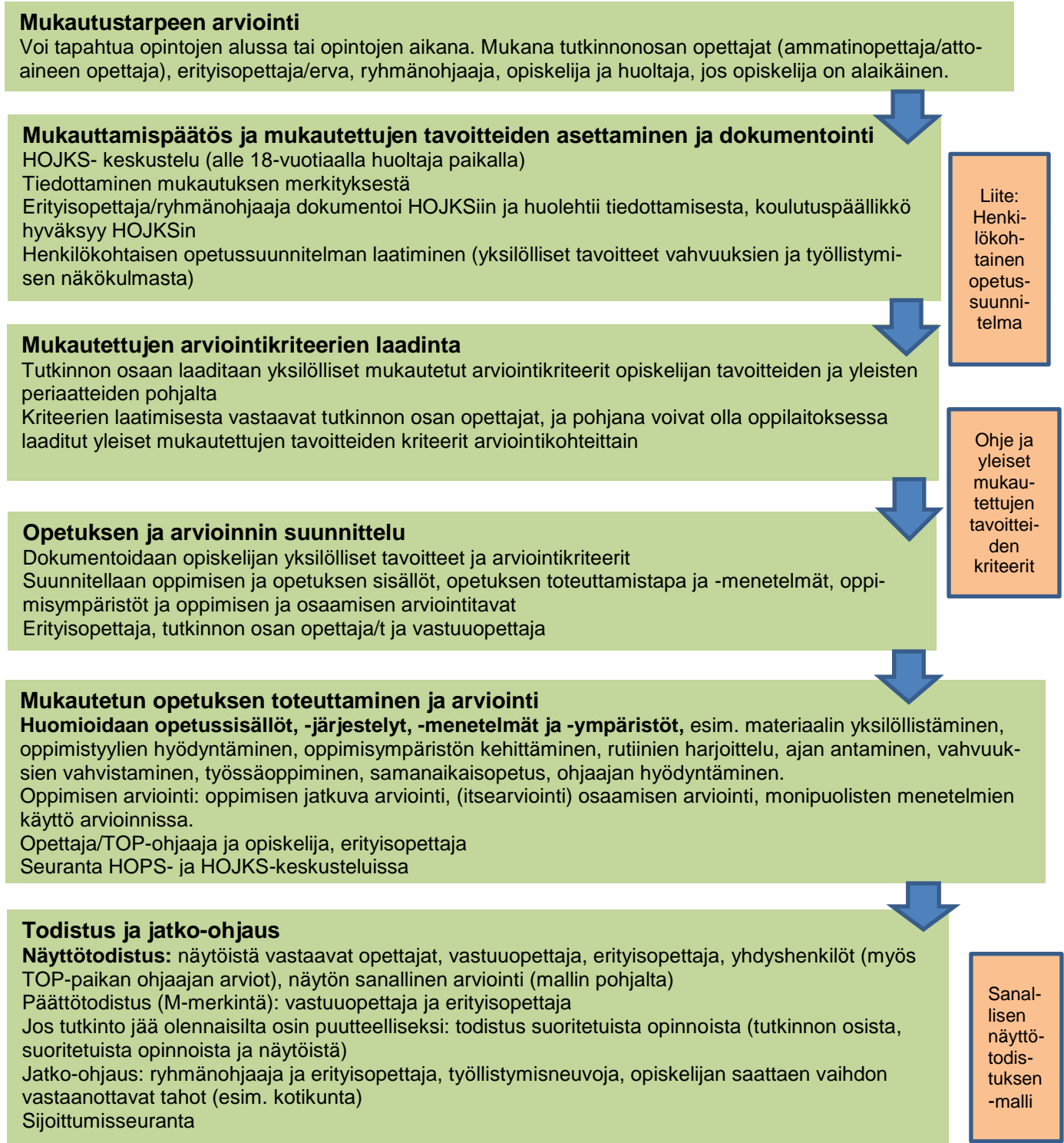
Kuvio 3 Esimerkki mukauttamisprosessista