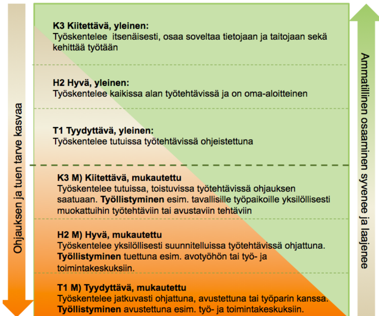
Kuvio 6. Mukautettujen arviointikriteereiden laadinta

Mukautettuja arviointikriteerejä luotaessa käytetään lähtökohtana T1-tason kriteerejä. Mukautetun kiitettävän tason ammattitaitovaatimukset ja tavoitteet ovat vaatimustasoltaan kapea-alaisempia kuin mitä tutkinnon perusteiden T1-tasolla vaaditaan. Mukautetut ammattitaitovaatimukset ja tavoitteet voidaan laatia kaikille mukautettaville tutkinnon osille käytössä olevan arvosana-asteikon eri tasoille (mukautettu kiitettävä K3, mukautettu hyvä H2 ja mukautettu tyydyttävä T1).