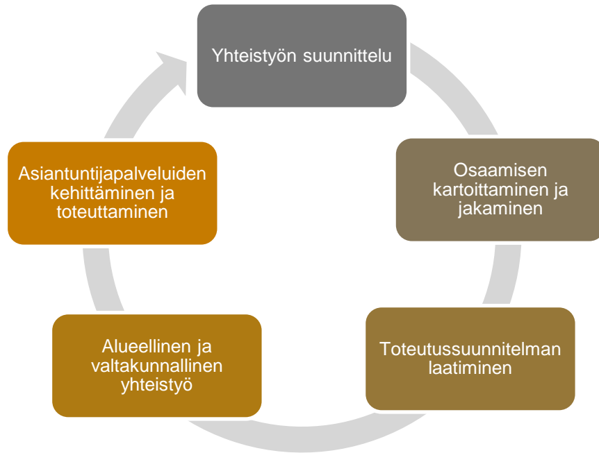
Kuvio 2. Yhteistyö AMEO-verkoston ja rajatun erityistehtävän oppilaitosverkoston kanssa

AMEO-verkoston ja rajatun erityistehtävän saaneiden oppilaitosten yhteistyö valtakunnallisella tasolla on edennyt alla kuvatun prosessin mukaisesti: